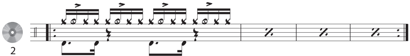
Rim shot variation & snare / Variante rim shot + caisse claire avec le rim