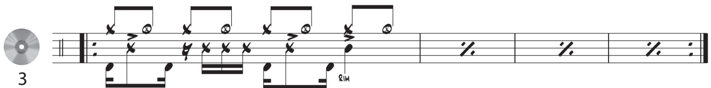
Rim shot variation & snare / Variante rim shot + caisse claire avec le rim